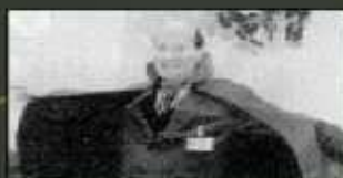
Prof de "Phases sectes et cultes" à l'Université catholique de Milan (Italie) et directeur de l'Observatoire Diabolisme Traditionaux de la USC/ICP

alias comité Europe ambassadeur d'Italie