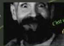
C'est une plaisanterie (Charlie)