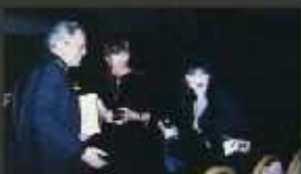
Membre du Council on Religious Liberty and the Separation of Church and State

alias Center Director Ambassador des Etats Unis